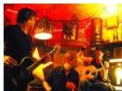
El'ke unplugged (8 Bilder)