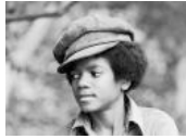
50 Jahre Pop (12 Bilder)